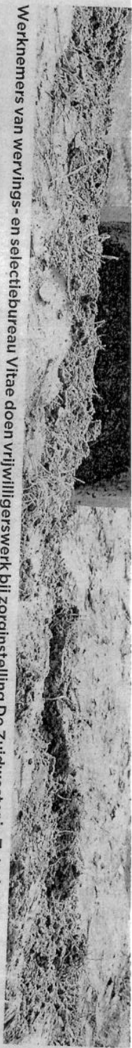
Werknemers van wervings- en selectiebureau Vitae doen vrijwilligerswerk bij zorginstelling De Zuidwester in Teteringen.